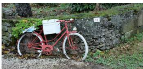
Saisy - novembre 2016

Si vous êtes intéressé venez faire un essai à partir du 6 septembre.