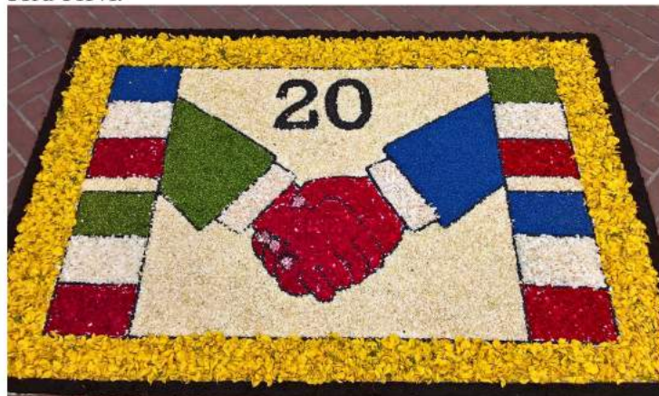
Tableau jumelage en fleurs naturelles

A leur arrivée le vendredi à 10h30, les Italiens seront accueillis par les enfants des écoles. Après la visite des Hospices de Beaune et celle de la ville de Chalon sur Saône une soirée paulée, salle Saint-Hilaire, leur sera proposée samedi soir, soirée à laquelle vous êtes invités (coupon d'inscription ci-joint). Dimanche ils découvriront un peu d'histoire de Fontaines avec le circuit des lavoirs et les carrières où un pique-nique leur sera servi.