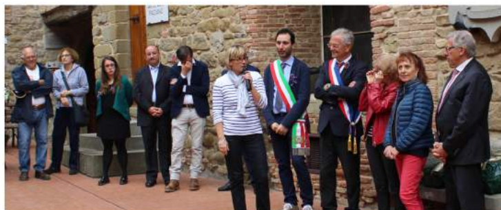
Cérémonie des 20 ans du jumelage