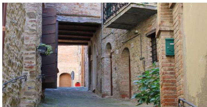
Une rue de Paciano