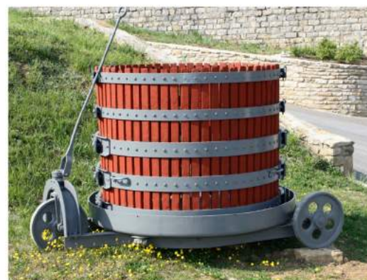
Montagny les Buxy - avril 2017