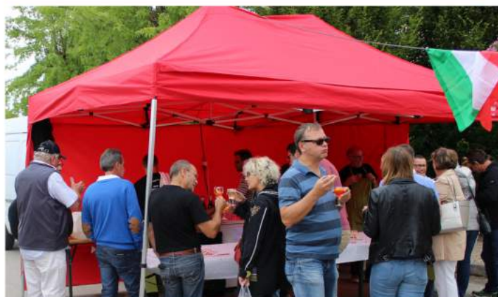
Photos du marché italien du dimanche 2 juillet 2017

Fontaines Echanges vous propose un autre rendez-vous le dimanche 5 novembre à 16 heures, salle Saint-Hilaire. La troupe « Et pourquoi pas nous » de Saint-Marcel présentera la comédie de Coline SERREAU "Lapin, lapin". Un bon moment à passer avec la famille LAPIN dans laquelle tout se passe assez bien : Mama fait son possible pour que tout le monde soit heureux. Mais lorsqu'un jour la vie dérape et que les ennuis s'accumulent, Mama ne sait plus où donner de la tête...