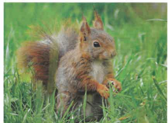
Ecureuil roux.