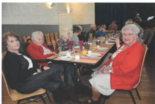
Goûter des aînés 2022