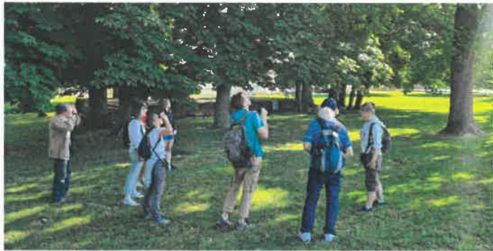
Animation LPO "chants des oiseaux"

Préserver l'environnement humain naturel, c'est préserver le devenir d'une espèce à laquelle nous sommes finalement assez attachés : l'homme !