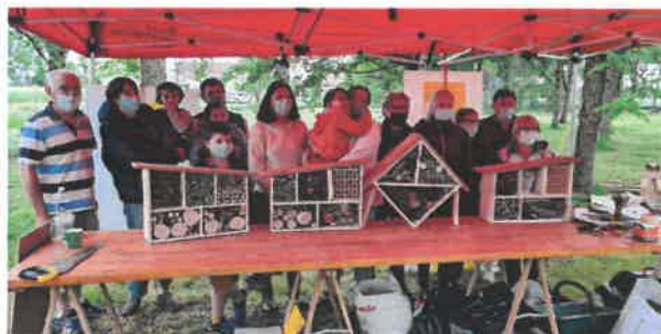
Journée verte 2021

La journée citoyenne, appelée journée verte sur notre commune, favorise la participation de chacun et constitue une véritable fabrique de liens sociaux. La cohésion, l'entraide, le partage, la convivialité sont les clés de voûte de cette journée.